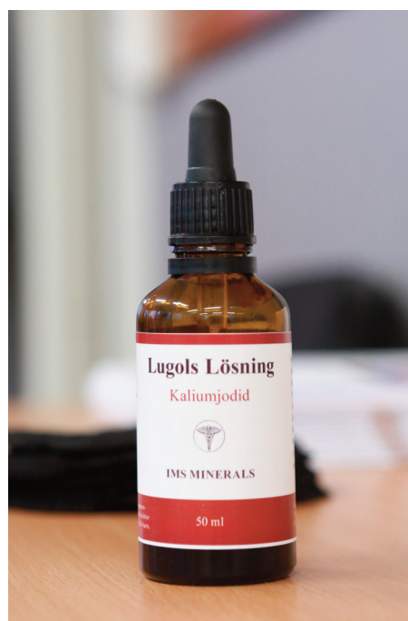
Lugols lösning (kaliumjodid).

Vi fick även lära oss att utföra jodtest. Vi fick stryka ut 1 droppe Lugols lösning på insidan av underarmen. Fläcken ska synas i 12 timmar, annars så har man jodbrist. Det är ingen exakt mätmetod men en god indikation på hur min jodstatus är. I tabellen kan du utläsa hur många droppar av Lugols lösning man