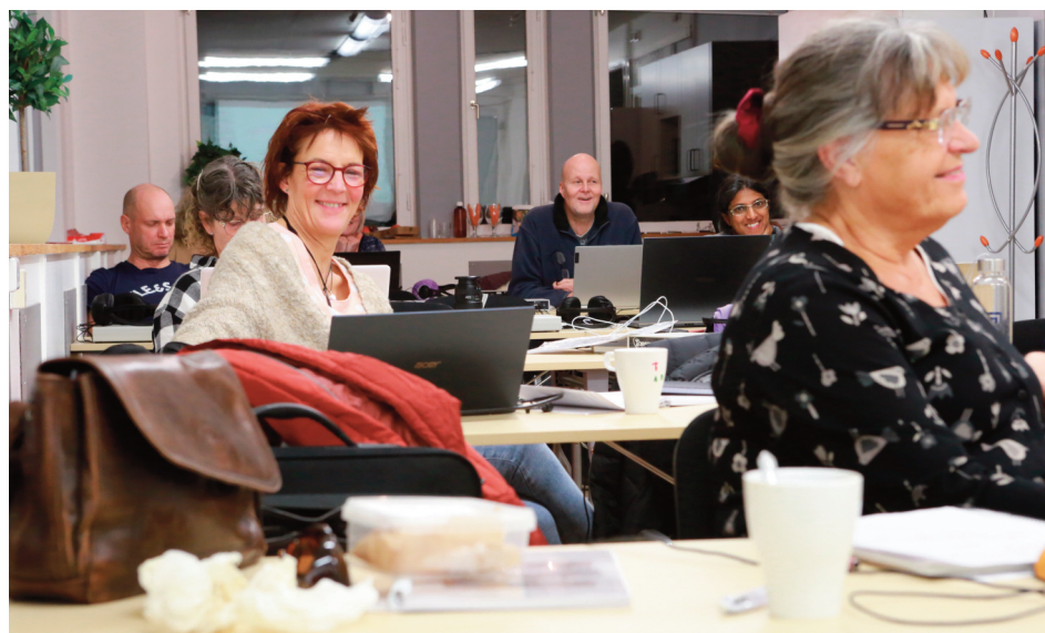
Glada miner i kurslokalen i Hallstahammar.

En 59-årig kvinna hade ett konstaterat diskbråck i nacken med mycket smärta i skuldra, nacke och med strålning ut i vänster arm. Terapeuten analyserade och behandlade alla nerver, muskler, bindväv, senor, nerver – särskilt nacke, ryggrad samt lymfa i arm, bröst och hals. Även enskilda bröst- och halskotor samt brösttrygg analyserades. Neuralgi av kranialnerver samt perifera nerver behandlades. Kvinnan fick även näringstillskott. Efter tre veckor med total fem behandlingar så var det stor skillnad, och kvinnan var i princip smärfri. Läkaren trodde att det skulle ta minst 3-4 månader för det att läka ut.